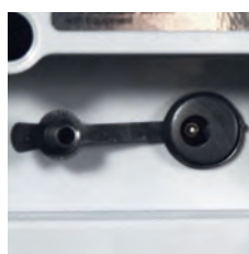
Proteção na entrada de alimentação